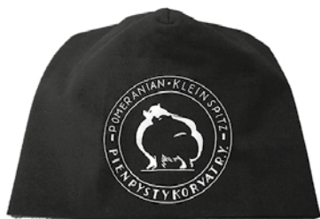
Pienpystykorvat HEIJASTINPIPO 16 €, sis. postikulut

Trikoopipo heijastavalla yhdistyksen logolla. Yksi koko, sopii n. 56-59 cm päähän. Kaksinkertainen neulos. Värit: musta, sininen, pinkki ja keltainen.