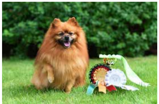
VSP VET Tirhan Lucky Break.