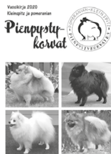
VUOSIKIRJAT 2021 Vuoden 2021 kleinpitz ja pomeranian tulokset, hinta 10€

Vuosikirjat 2017,2018 ja 2019 alennuksessa: pommit 3 € ja kleinit 5 €. (2018 kleinikirjat loppu)