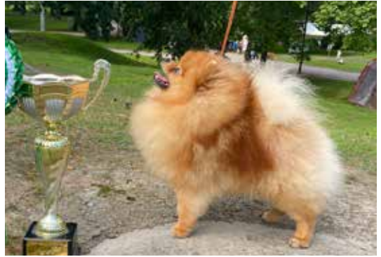
VSP Fur Band Emperor Of Delight.