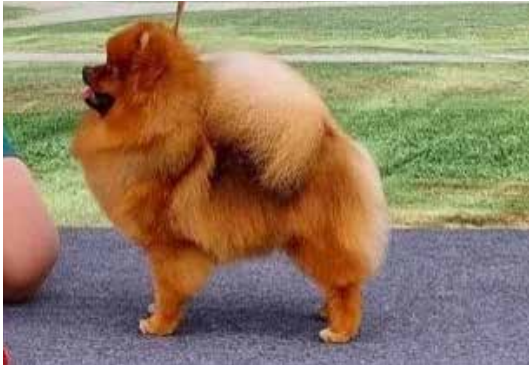
ROP Linnanhaltijan Dublin.