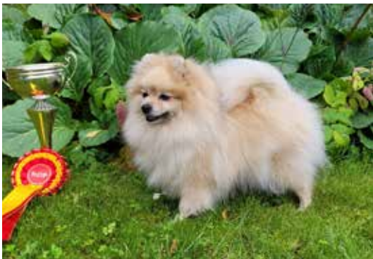
ROP Tirhan Jealous Sky.