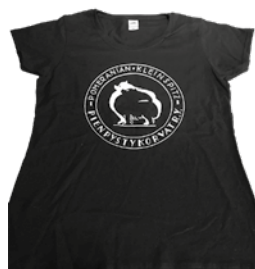
T-paidat 12 € + postikulut Koot S, M ja L.

Trikoopipo heijastavalla yhdistyksen logolla. Yksi koko, sopii n. 56-59 cm päähän. Kaksinkertainen neulos. Värit: musta, sininen, pinkki ja keltainen.