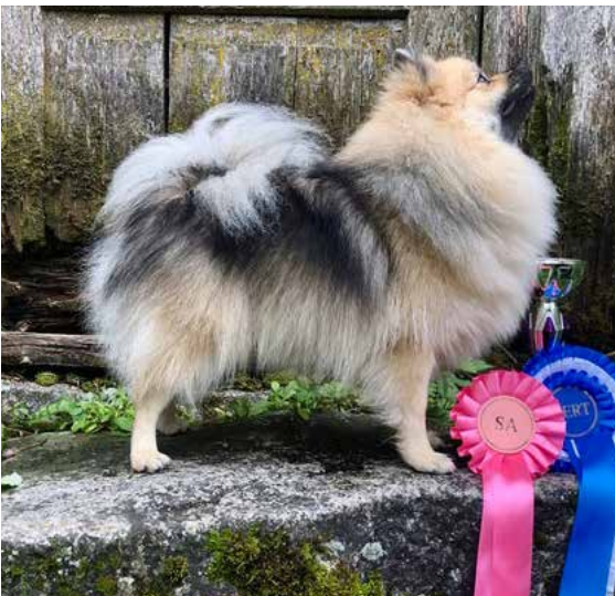
Kettuvaaran But First Business, Cava.

Kuten jo mainitsin, olen aina pitänyt pienpystykorvien ulkonäöstä. Ensimmäisen oman koirani ja samalla pienpystykorvan hankin vuonna 2014. Rotu ylitti odotukseni täysin jo