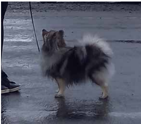
Zibacan Brave Heart