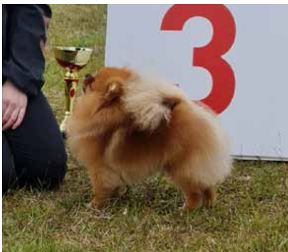
Marmotina Kleopatra of Easter Egg