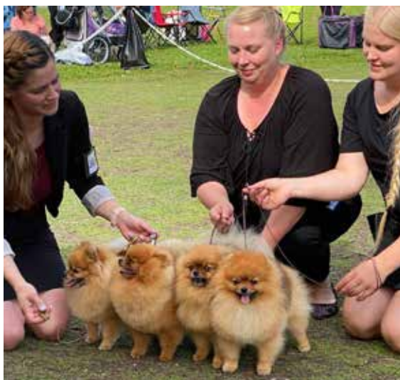
ROP KASV Soulhill's.