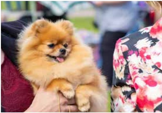
ROP VET Soulhill's Duchess.