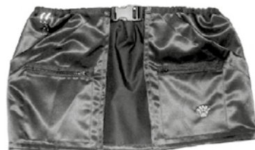
Berran treenitasku Pienpystykorvat –brodeerauksella koot M-L, 29 € Huom! Rajoitettu erä!