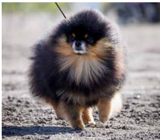
Pipperoo Comes In All Colours