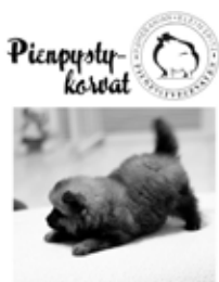
Pennunhoito-opas 4 kpl oppaita yht. 10€ 8 kpl oppaita yht. 15€ hinnat sis. postikulut

Vuosikirjat 2017,2018 ja 2019 alennuksessa: pommit 3 € ja kleinit 5 €. (2018 kleinikirjat loppu)