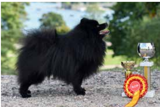
ROP Tempore By the Way.