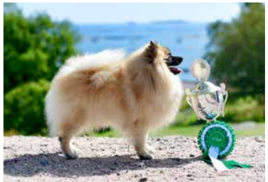
VSP Tirhan Xtra Factor.