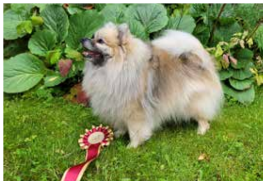
ROP VET, PN3 Tirhan Eshet Hail.